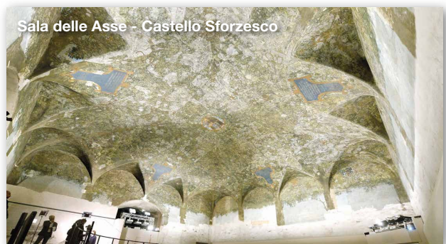
Sala delle Asse - Castello Sforzesco

Partenza alle ore 13.30 per il CASTELLO SFORZESCO DI MILANO . Visita guidata agli affreschi di Leonardo nella Sala delle Asse in fase di restauro. Una installazione multimediale approfondisce la conoscenza dell'opera che fu ideata per celebrare Ludovico il Moro. Quota di partecipazione € 25 (comprende trasporto, ingresso e guida).